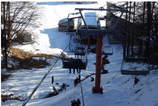
飯綱高原スキー場