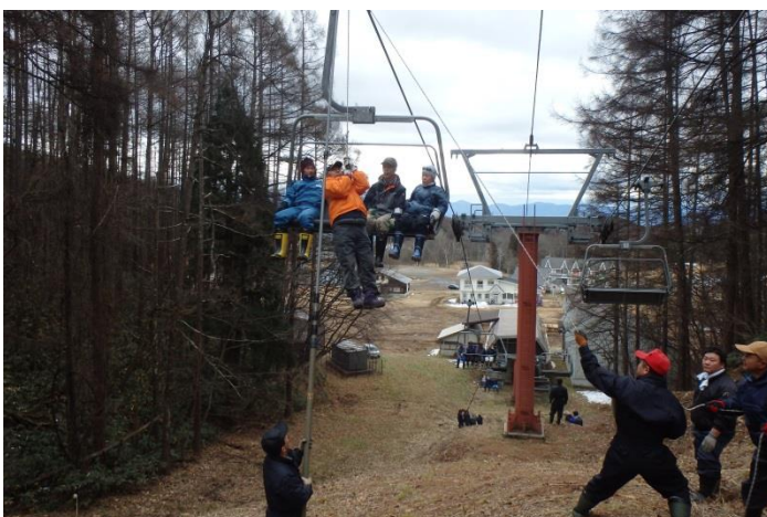
飯綱高原スキー場