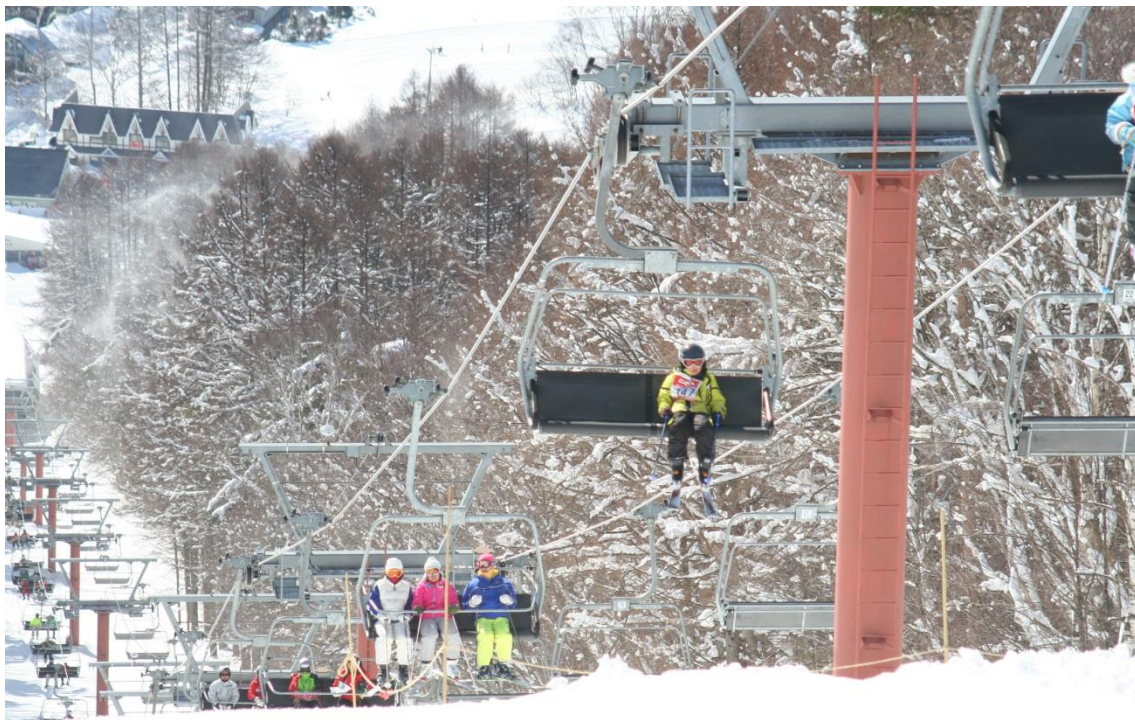
飯綱高原スキー場 第1クワッドリフト