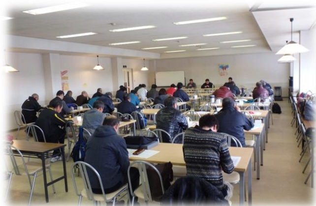
従業員索道研修の様子