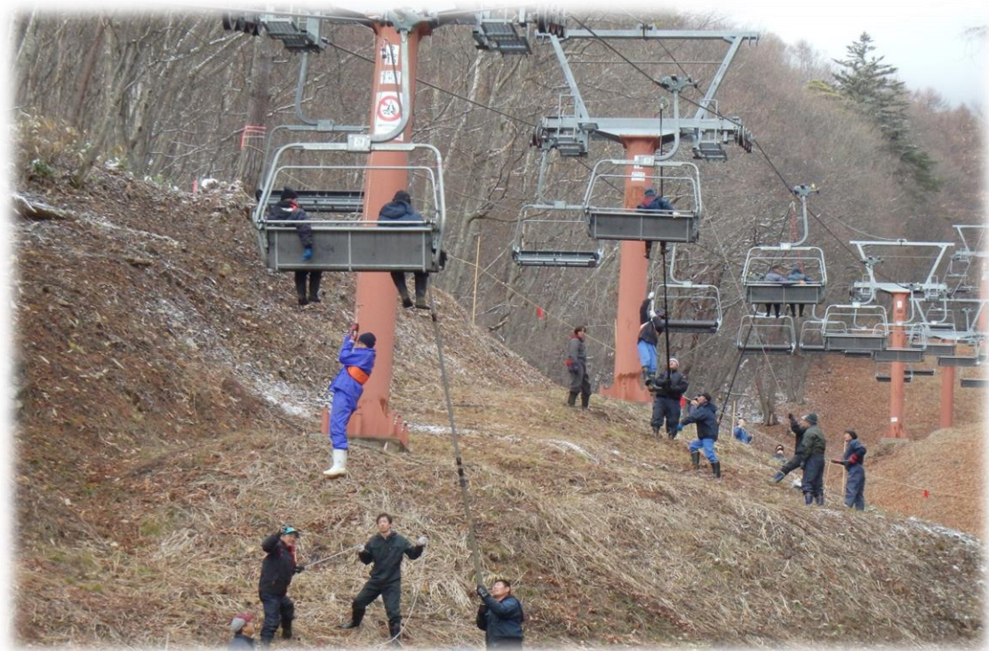
飯綱高原スキー場 救助訓練