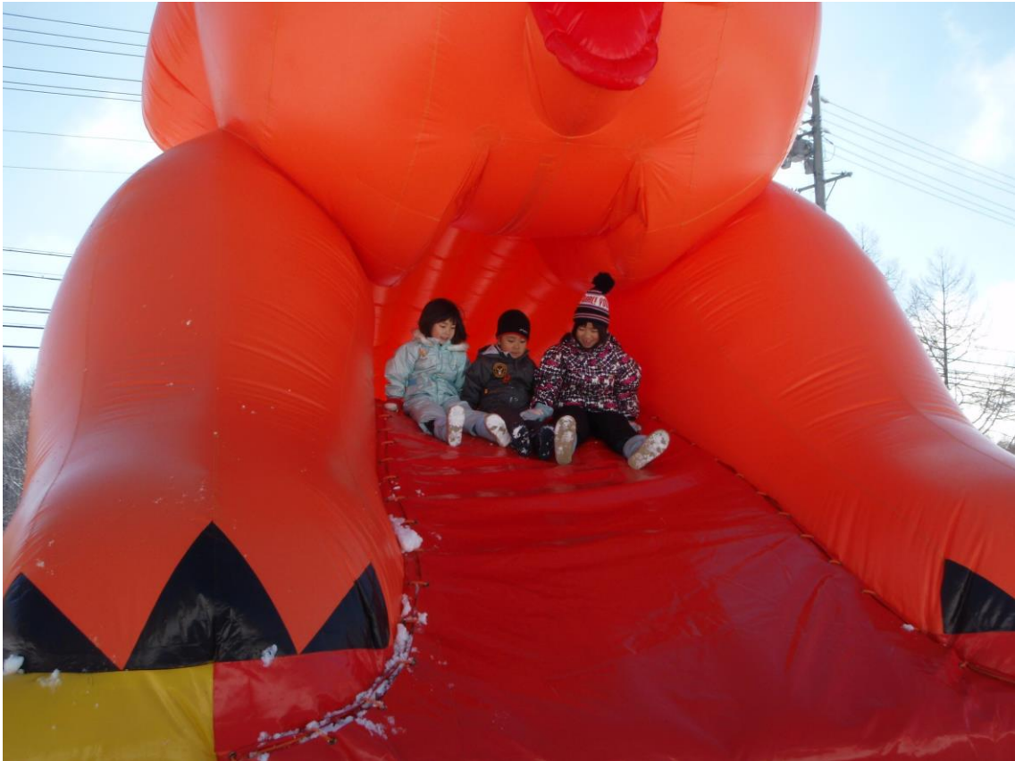
飯綱高原スキー場 キッズパーク